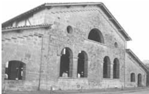
(Oficina da Flona Ipanema – Sorocaba-SP – Castro, 2007)